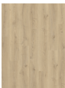
ROBLE CIUDAD ● PRO L0231-03868 ● L0331-03868