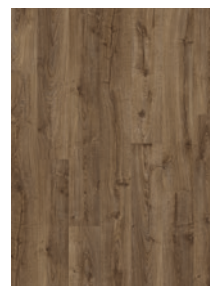
ROBLE GRANJA ● PRO L0231-03371 ● L0331-03371