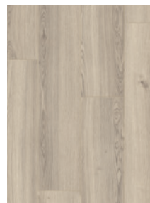
ROBLE LITORAL ● L0365-04395 | BISEL ● L0364-04395 | SIN BISEL