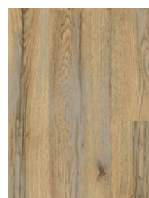
ROBLE ARTESANO ● PRO L0245-05006 ● L0345-05006