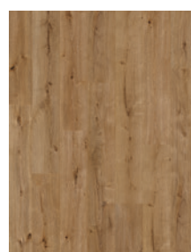
ROBLE RIBERA ● PRO L0239-04301 ● L0339-04301