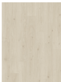
ROBLE GLACIAR ● PRO L0263-06799 ● L0363-06799