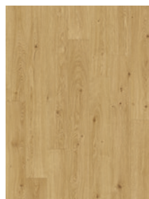
ROBLE SOLSTICIO ● PRO L0263-06800 ● L0363-06800