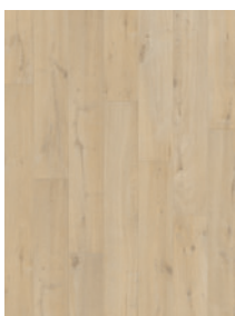
ROBLE COSTERO ● PRO L0231-03374 ● L0331-03374