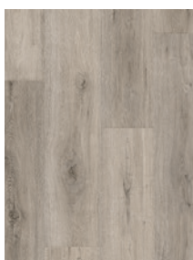
ROBLE DARTMOOR ● PRO L0248-05020 ● L0348-05020