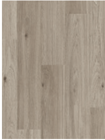
ROBLE CONFORT GRIS