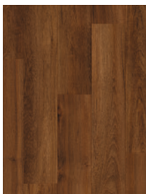
TECA DE ARCILLA ROJA