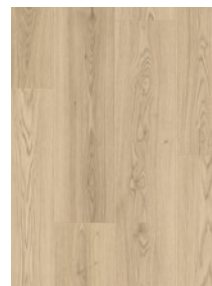
ROBLE RÍO ● L0365-04389 | BISEL ● L0364-04389 | SIN BISEL