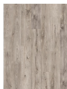
ROBLE GRANERO GRIS ● PRO L0239-04303 ● L0339-04303