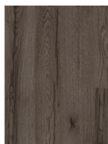
ROBLE RIVER ROCK ● PRO L0245-05004 ● L0345-05004