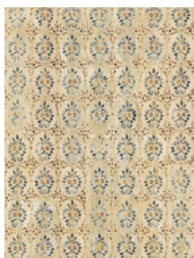
FOLK ● PRO L0263-06798 ● L0363-06798