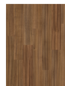
ROBLE DE TASMANIA ● PRO L0239-04317 ● L0339-04317