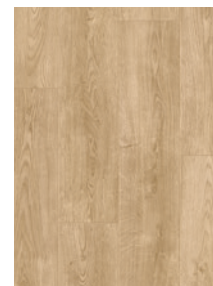
ROBLE BEIGE NATURAL ● L0365-04390 | BISEL ● L0364-04390 | SIN BISEL