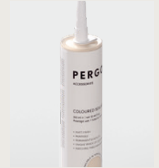
SELLADOR CON COLOR