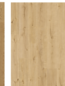
ROBLE ISLA ● PRO L0239-04297 ● L0339-04297