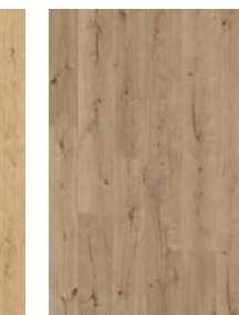
ROBLE TUNDRA ● PRO L0239-04299 ● L0339-04299