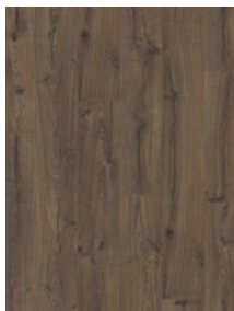
ROBLE PUENTE ● PRO X L0139-04609