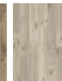
ROBLE GRIS VINTAGE ● PRO L0239-04311 ● L0339-04311