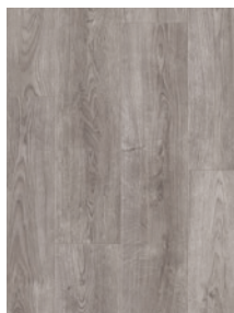
ROBLE VIÑEDO ● L0365-04386 | BISEL ● L0364-04386 | SIN BISEL