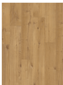
ROBLE RÚSTICO ● PRO L0231-03375 ● L0331-03375