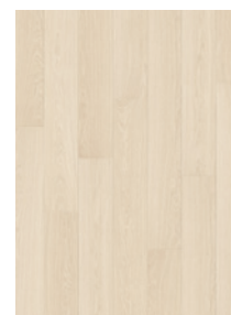
ROBLE DANÉS MODERNO ● PRO L0231-03372 ● L0331-03372