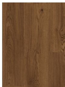
ROBLE FLORAL ● PRO L0245-04994 ● L0345-04994