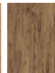
ROBLE GRANERO ● PRO L0239-04307 ● L0339-04307