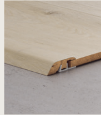
MOLDURA INCIZO® 5 EN 1