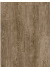
ROBLE CAÑÓN ● L0365-04393 | BISEL ● L0364-04393 | SIN BISEL