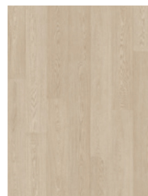
ROBLE ARENA NÓRDICA ● PRO L0239-04291 ● L0339-04291