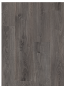
ROBLE GRIS OSCURO ● PRO L0247-01805 ● L0347-01805