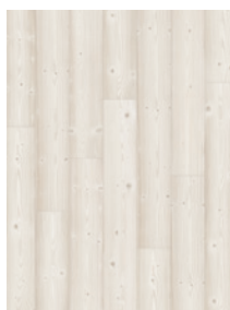
PINO BLANCO CEPILLADO ● PRO L0231-03373 ● L0331-03373