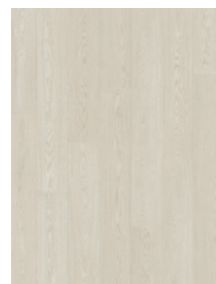
ROBLE CABO NORTE ● PRO L0239-04289 ● L0339-04289