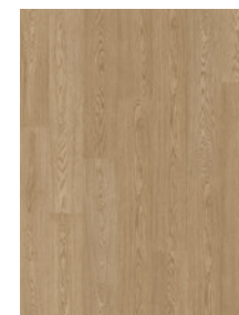
ROBLE SKAGEN ● PRO L0239-04293 ● L0339-04293