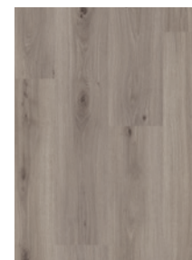
ROBLE MAINE ● PRO L0247-05026 ● L0347-05026