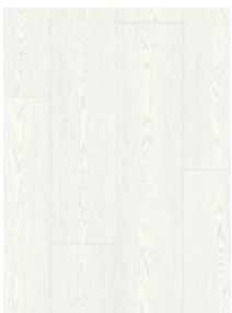
ROBLE BLANCO LECHE ● L0365-04387 | BISEL ● L0364-04387 | SIN BISEL