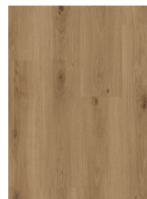
ROBLE CABAÑA SUAVE ● PRO L0247-05025 ● L0347-05025