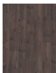
PINO GASTADO ● PRO L0239-04315 ● L0339-04315