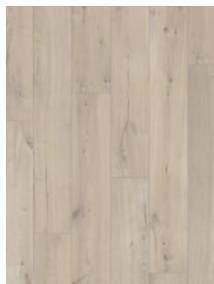
ROBLE DUNA ● PRO X L0139-04450