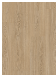
ROBLE ISLA ● PRO L0248-05016 ● L0348-05016