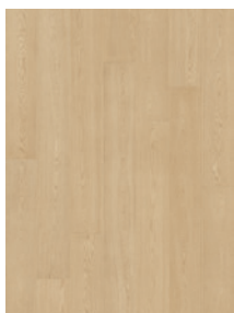
ROBLE AVENA ● PRO L0263-06792 ● L0363-06792