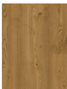
ROBLE BORGIO ● PRO L0245-05000 ● L0345-05000