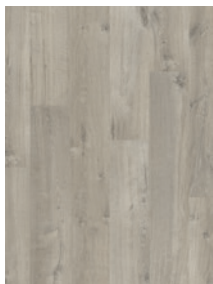
ROBLE PLAYA GRIS ● PRO X L0139-05188