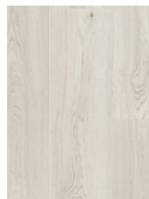
ROBLE MARINO ● PRO L0245-04998 ● L0345-04998