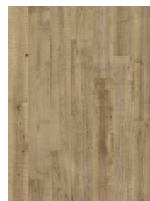
ENCANTO RÚSTICO ● PRO L0263-06802 ● L0363-06802