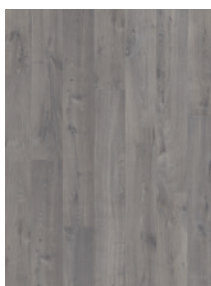
ROBLE GRIS URBANO ● PRO L0231-03368 ● L0331-03368