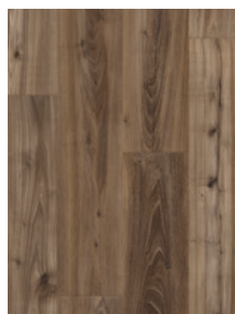
ROBLE CUERO ● PRO L0248-05013 ● L0348-05013