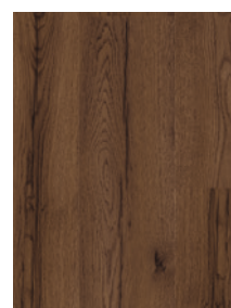
ROBLE CABAÑA ● PRO L0245-05005 ● L0345-05005