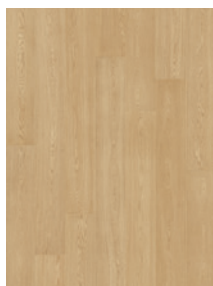
ROBLE MALTA ● PRO L0263-06793 ● L0363-06793