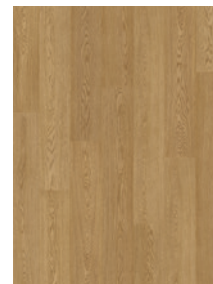
ROBLE PRIME ● PRO X L0139-05191