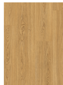
ROBLE CAPPUCCINO ● PRO L0248-05018 ● L0348-05018