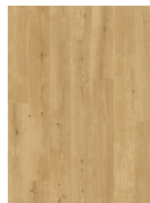
ROBLE VIBRANT ● PRO L0263-06796 ● L0363-06796