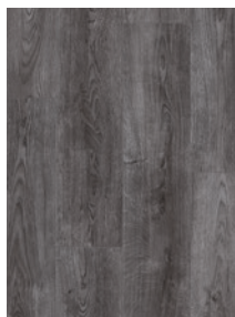
ROBLE GRIS ELEGANTE ● L0365-04388 | BISEL ● L0364-04388 | SIN BISEL