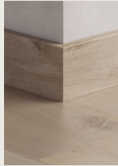
RODAPIÉ DE PARQUET