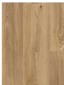
ROBLE VALLE ● PRO L0245-04995 ● L0345-04995