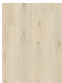
ROBLE MARINO ● PRO L0247-05027 ● L0347-05027