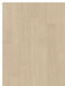
ROBLE ARCILLA ● PRO L0263-06791 ● L0363-06791