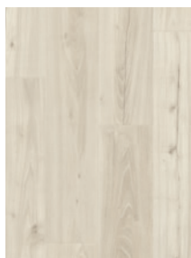
ROBLE SOMBRA ● PRO L0248-05015 ● L0348-05015