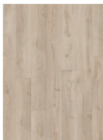
ROBLE NUEVA INGLATERRA ● PRO L0231-03369 ● L0331-03369