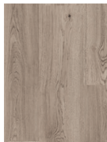
ROBLE NORTE ● PRO L0245-04997 ● L0345-04997