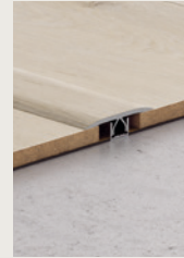
PERFIL DE DILATACIÓN COMERCIAL