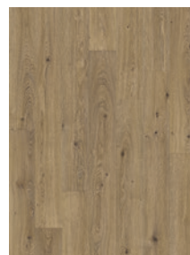
ROBLE BEAUFORT ● PRO L0263-06801 ● L0363-06801