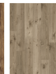
ROBLE PRADO ● PRO L0239-04309 ● L0339-04309