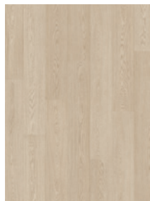
ROBLE PRIME CLARO ● PRO X L0139-05190