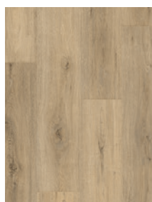
ROBLE CORNWALL ● PRO L0248-05019 ● L0348-05019