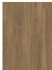
ROBLE RICARD ● PRO L0248-05017 ● L0348-05017