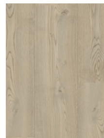
ROBLE VITALETA ● PRO L0245-04999 ● L0345-04999