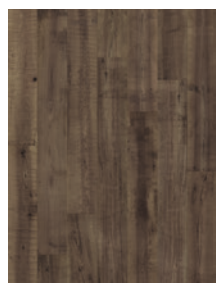
HUMO RÚSTICO ● PRO L0263-06803 ● L0363-06803