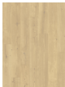
ROBLE OSCURECIDO ● PRO L0263-06794 ● L0363-06794