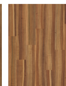
NOGAL REFINADO ● PRO L0239-04319 ● L0339-04319