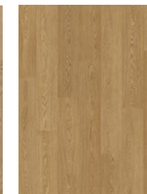
ROBLE ESTOCOLMO ● PRO L0239-04295 ● L0339-04295