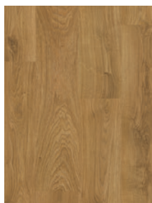
ROBLE NATURAL ● PRO L0247-01804 ● L0347-01804