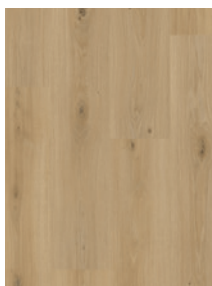
ROBLE VIÑA ● PRO L0247-05023 ● L0347-05023