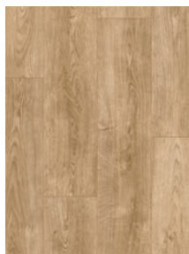
ROBLE ECLESIASTICO ● L0365-04392 | BISEL ● L0364-04392 | SIN BISEL