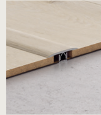
PERFIL DE DILATACIÓN COMERCIAL