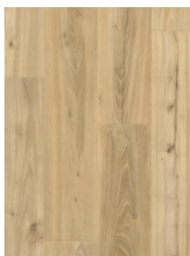
ROBLE ONDA ARENA ● PRO L0248-05014 ● L0348-05014