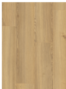
ROBLE NATURAL CÁLIDO ● L0365-04394 | BISEL ● L0364-04394 | SIN BISEL