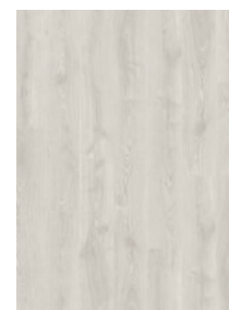
ROBLE ESTUDIO ● PRO L0231-03867 ● L0331-03867