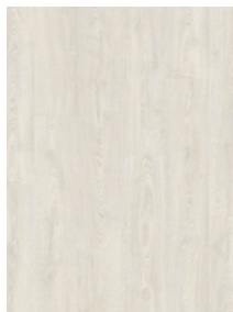
ROBLE GRIS SUAVE ● PRO X L0139-05189