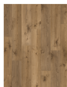
ROBLE FINCA ● PRO L0239-04313 ● L0339-04313