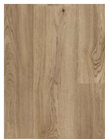
ROBLE ABADIA ● PRO L0245-04996 ● L0345-04996