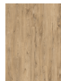
ROBLE MARISMAS ● PRO L0239-04305 ● L0339-04305