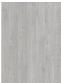
ROBLE GRIS CALIZO ● PRO L0231-03367 ● L0331-03367