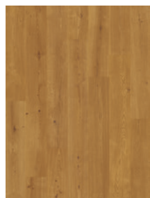
ROBLE ATARDECER ● PRO L0263-06797 ● L0363-06797