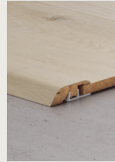
MOLDURA INCIZO® 5 EN 1