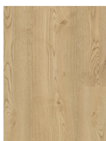
ROBLE PORT ● PRO L0245-05002 ● L0345-05002