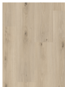
ROBLE BRUMA ● PRO L0247-05024 ● L0347-05024