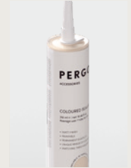
SELLADOR CON COLOR