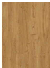
ROBLE SEÑORAL ● PRO L0231-03370 ● L0331-03370