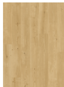
ROBLE CLARO ● PRO L0263-06795 ● L0363-06795