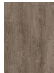
ROBLE TIERRAS ALTAS MARRÓN ● L0365-04391 | BISEL ● L0364-04391 | SIN BISEL