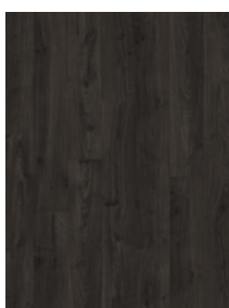
ROBLE PIMIENTA NEGRO ● PRO L0231-03869 ● L0331-03869