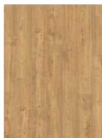
ROBLE VINTAGE CEPILLADO ● PRO L0231-03376 ● L0331-03376