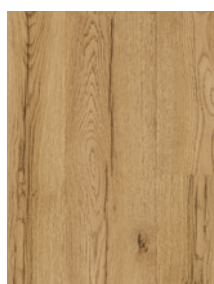
ROBLE SALVAJE ● PRO L0245-05003 ● L0345-05003