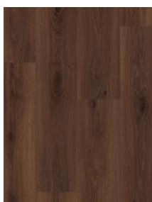
ROBLE POTTERY ● PRO L0247-05028 ● L0347-05028